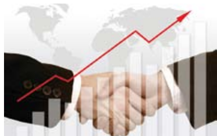
Eine Anhebung der Tariflöhne ist ab dem 1. Juli 2010 vereinbart.

● Nun ist es amtlich: Der neue Tarifvertrag zwischen dem Interessenverband Deutscher Zeitarbeitsunternehmen (iGZ) und dem DGB hat alle Hürden genommen und tritt zum 1. Juli 2010 in Kraft. Seine Laufzeit geht bis zum 31. Oktober 2013. Die Vereinbarung beinhaltet eine Erhöhung der Stundenlöhne in vier Schrit-