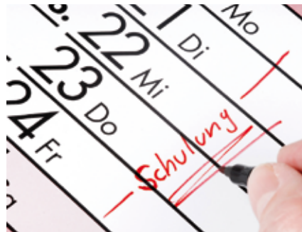
Auch wenn Weiterbildung Zeit und Geld kostet: Zusatzqualifikationen stehen hoch im Kurs.

Die Umfrage zeigt, wie hoch die Einsatzbereitschaft der Menschen ist, wenn es um ihre berufliche Weiterbildung geht: Sechs von zehn der Befragten können es sich sogar vorstellen, ihre Freizeit in eine berufliche Zusatzqualifikation zu investieren. Davon wiederum würden